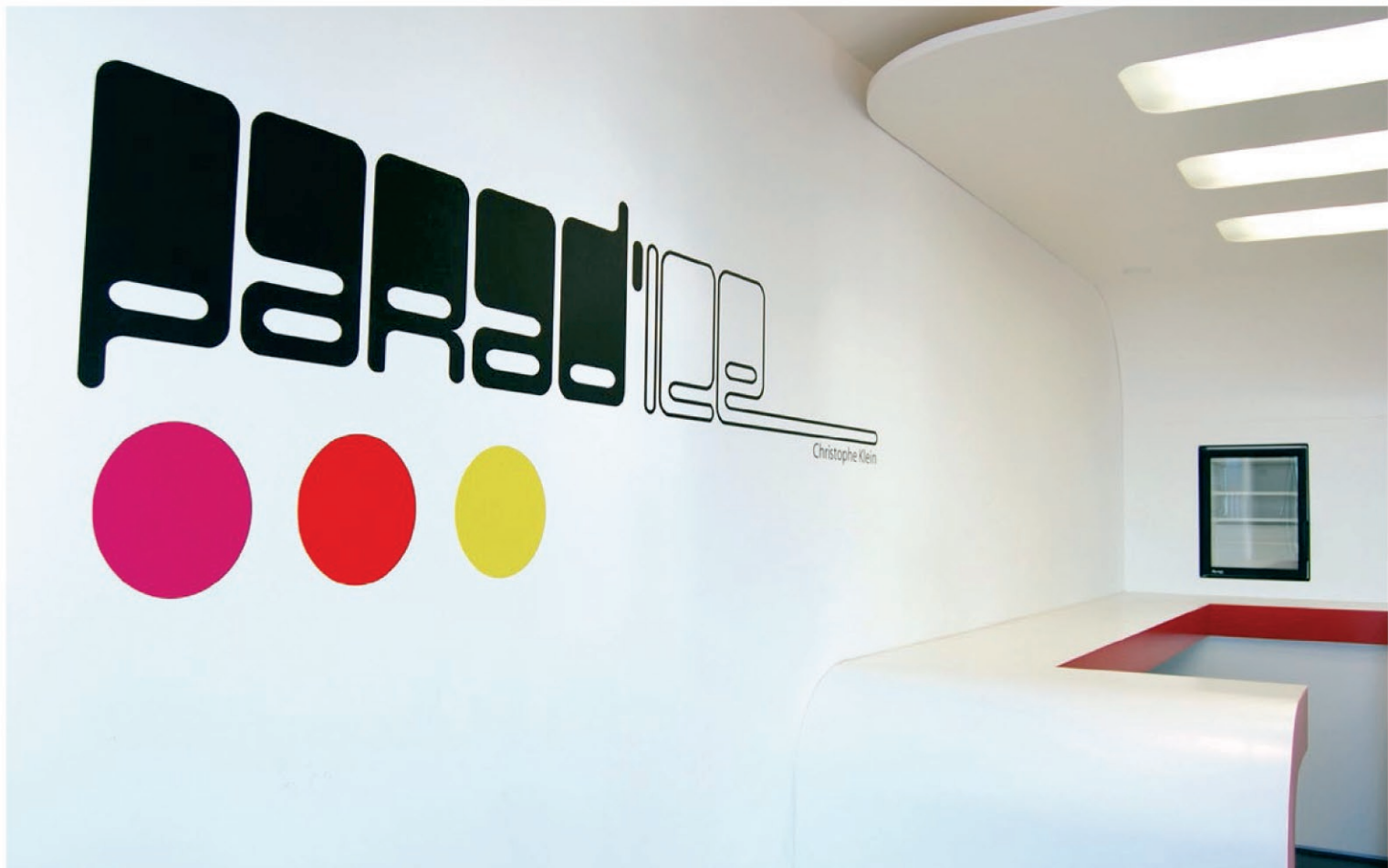
Parad'ice / Boulevard de la Mer / Chatelaillon-Plage / Réalisation 2009 Conception : Le Studio Pierre Antoine Compain /