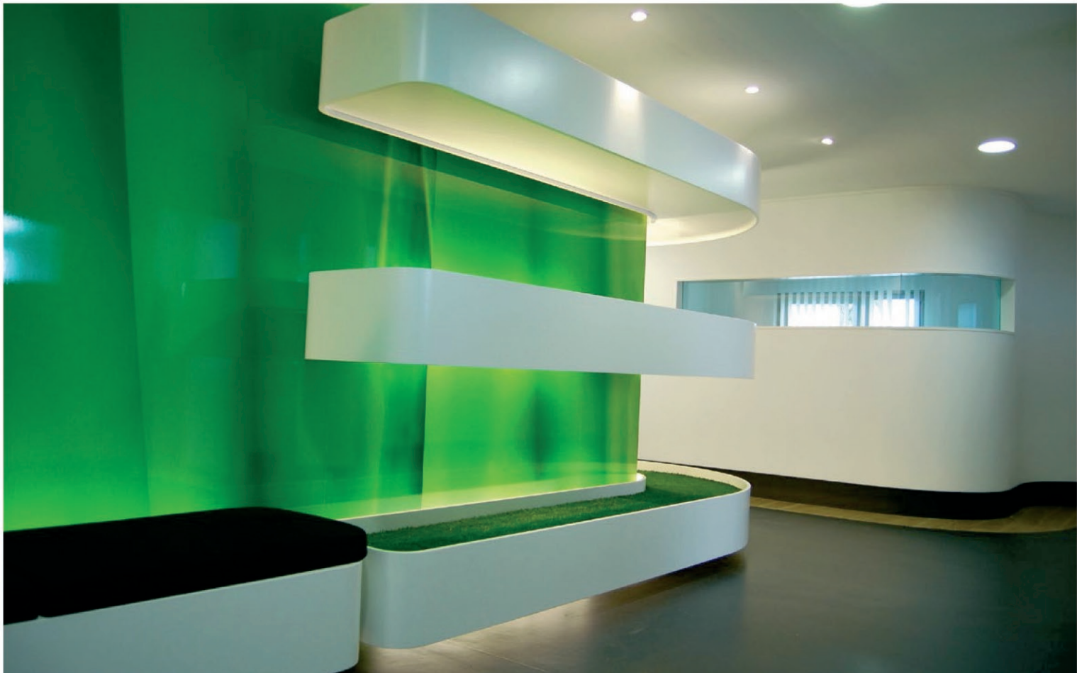
17 EXPERTISE / 1 Rue Cardinal / La Rochelle / Réalisation 2009 Conception : Le Studio Pierre Antoine Compain /