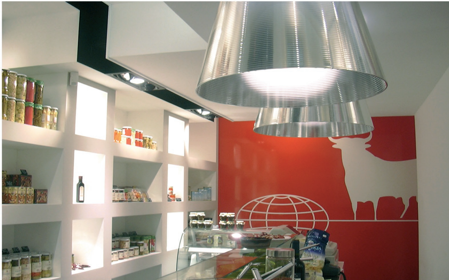
La Maison d'Espagne / La Rochelle / Réalisation 2010 Conception : Le Studio Pierre Antoine Compain /