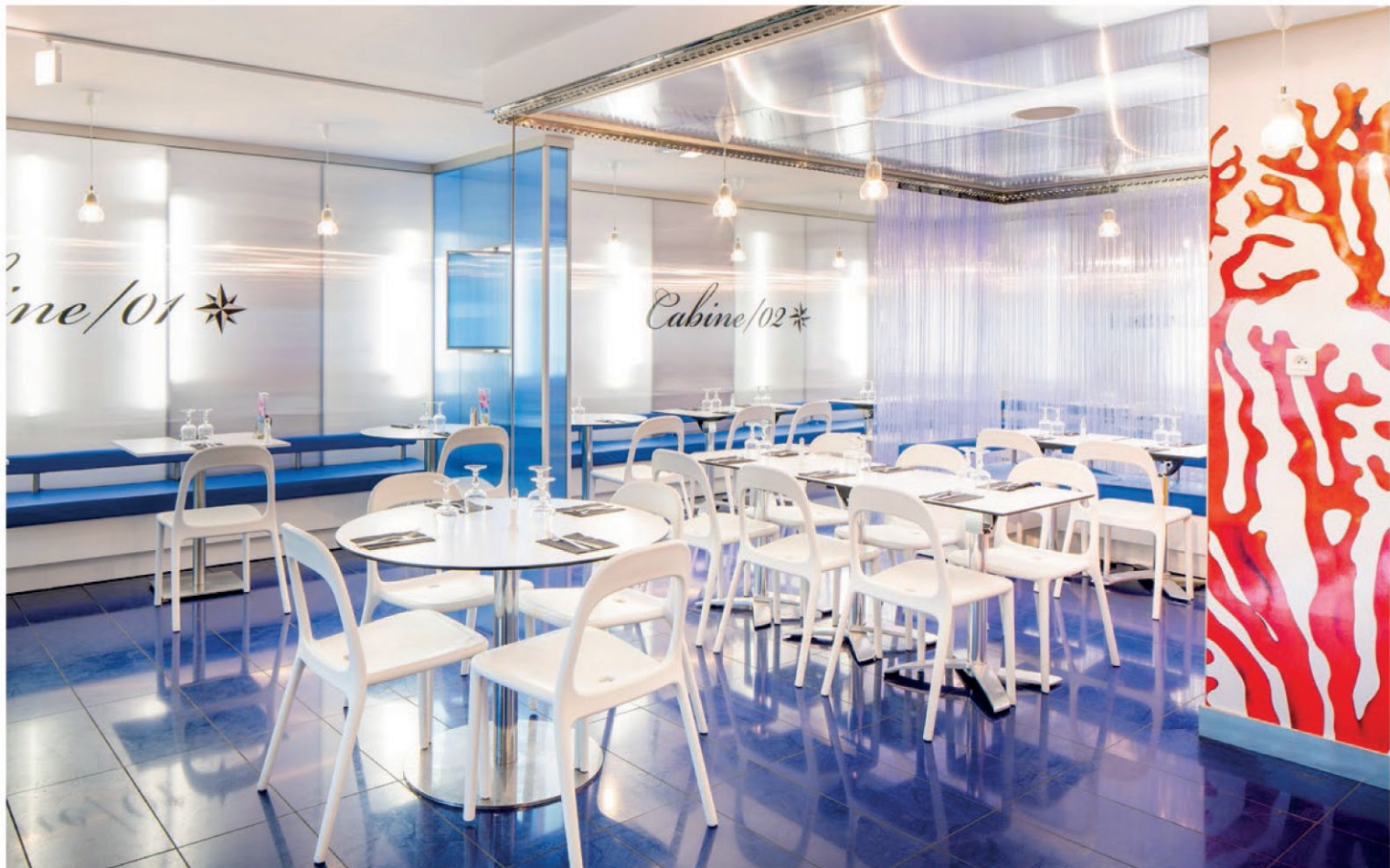
Brasserie Les Grands Yachts / Quai du Gabut / La Rochelle / Réalisation 2013 Conception : Le Studio Pierre Antoine Compain /