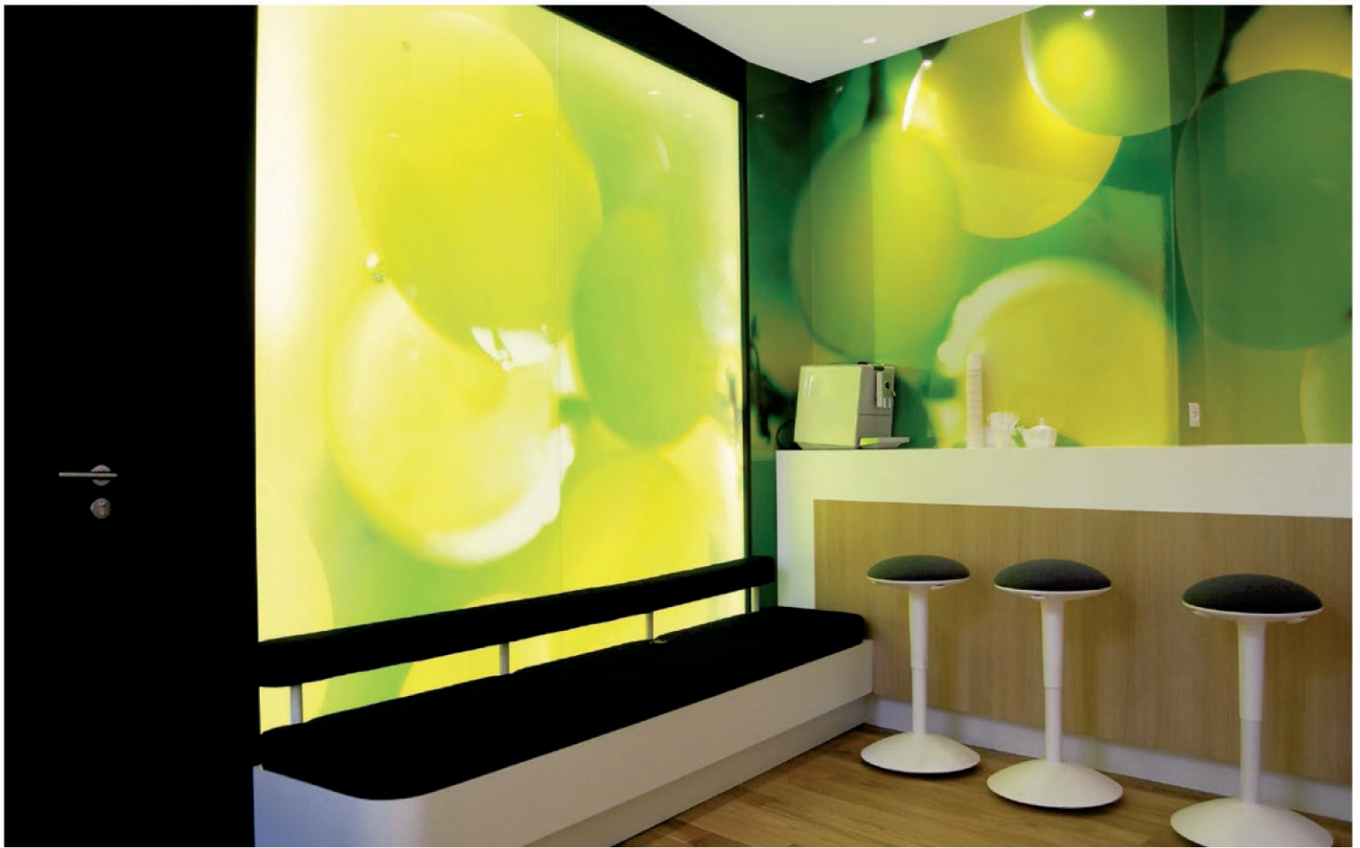
Cabinet Louvet / 41, Boulevard Denfert Rochereau / Cognac / Réalisation 2013 Conception : Le Studio Pierre Antoine Compain /