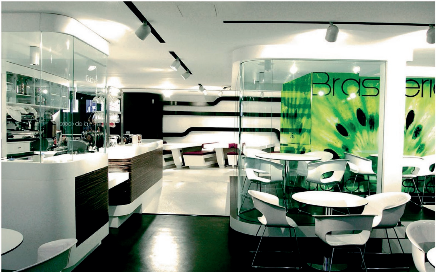
Brasserie de La Poste / Place de l'Hôtel de Ville / La Rochelle / Réalisation 2013 Conception : Le Studio Pierre Antoine Compain /