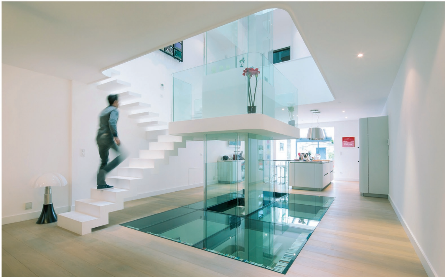
White House / maison d'habitation à usage privé / La Rochelle / Réalisation 2014 Conception : Le Studio Pierre Antoine Compain /