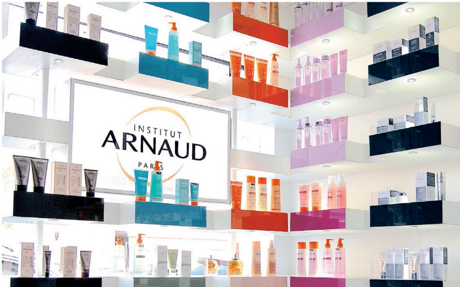
Institut Arnaud + Cottage / Avenue de la Libération / Le Bouscat / Réalisation 2013 Conception : Le Studio Pierre Antoine Compain /