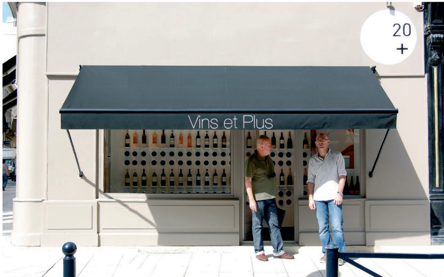
20 et + / Place des Grands Hommes / Bordeaux / Réalisation 2010 Conception : Le Studio Pierre Antoine Compain /